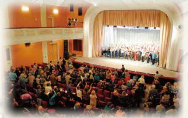
2013年ウラジオストク(ロシア)公演にて